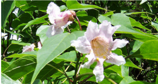
Nahaufnahme der Einzelblüte von Bunes Trompetenbaum

Wohin lohnt sich der Spaziergang dieser Tage besonders? Was gibt es zu entdecken? Und natürlich: Was blüht? Im 14-tägigen Abstand präsentieren die Hohenheimer Gärten jeweils eine botanische Besonderheit im Online-Kurier. Diese Woche: der Trompetenbaum ( Catalpa ).