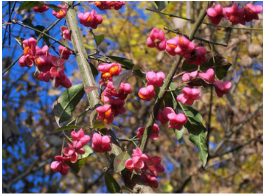
Vierkantige Zweige mit Früchten

Früchte mit ihren orangegefärbten Samen aussehen mögen, so ist Vorsicht geboten, denn diese und andere Pflanzenteile sind stark giftig.