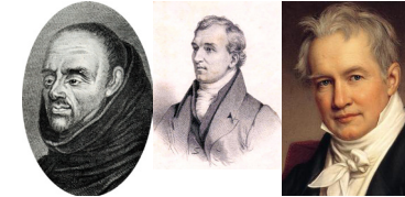
v. l. nach r. Plumier, Douglas und Humboldt